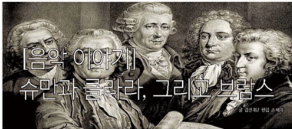
글 김진재 / 편집 스테디