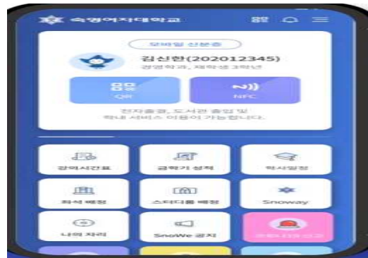
HEYING (APP) 숙명 모바일 서비스 종합 어플리케이션