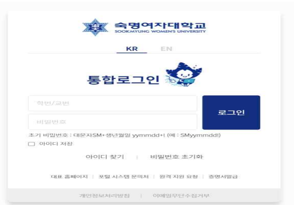
숙명포털시스템 학사 전반에 대한 정보를 제공하는 곳