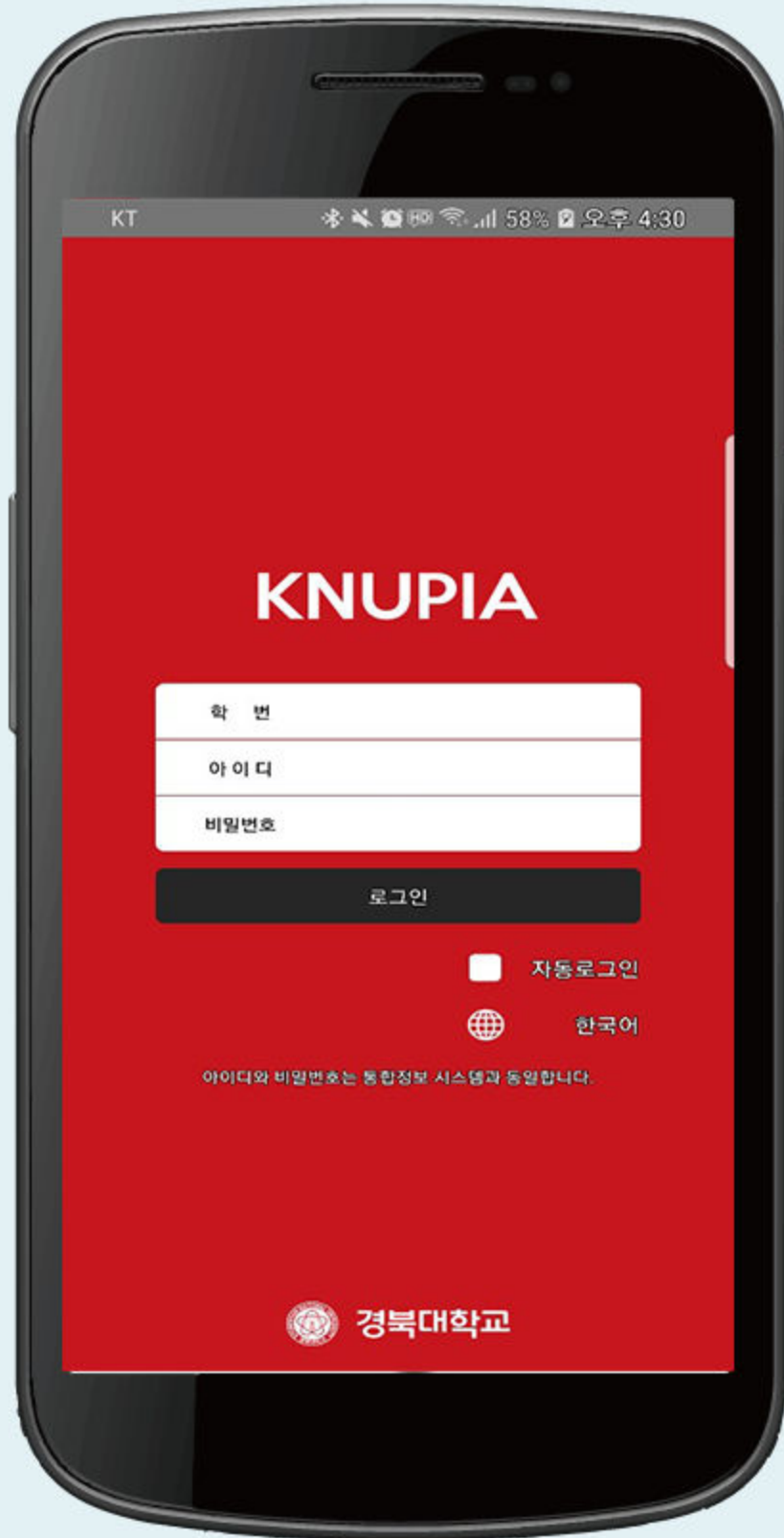
▲ 로그인 화면