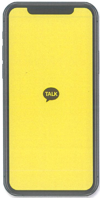
1 카카오톡을 실행해주세요.