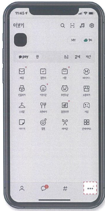
2 하단 오른쪽 '...' 탭 선택