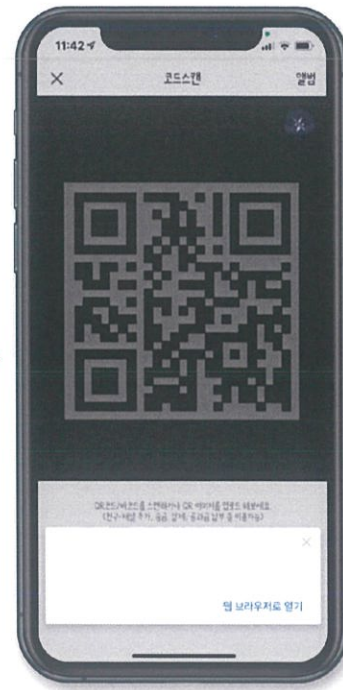
4 체크인을 원하는 교내 건물의 QR 코드를 스캔해 주세요.