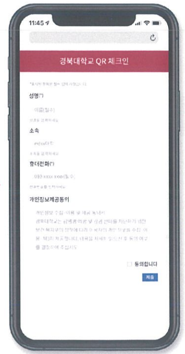
5 링크 접속 후 이름/소속/휴대전화 입력/ 개인정보 동의 후 제출 버튼을 선택해 주세요.